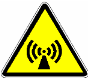
RADIAZIONI NON IONIZZANTI