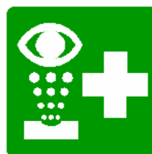
DOCETTA LAVAOCCHI DI EMERGENZA