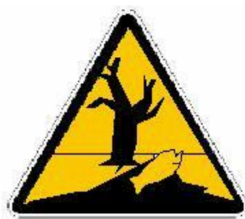
PERICOLOSO PER L'AMBIENTE