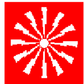
PULSANTE DI ALLARME ANTINCENDIO