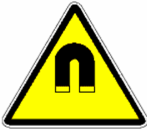
CAMPO MAGNETICO INTENSO