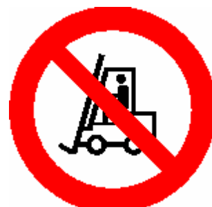
DIVIETO TRANSITO CARRELLI