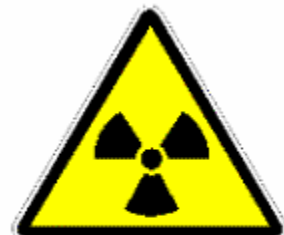
MATERIALI RADIOATTIVI RADIAZIONI IONIZZANTI