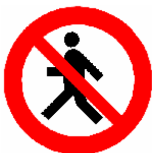
DIVIETO TRANSITO PEDONI