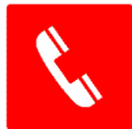
TELEFONO PER GLI INTERVENTI ANTINCENDIO