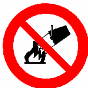
VIETATO SPEGNERE CON ACQUA