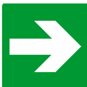
DIREZIONE DA SEGUIRE (cartello da aggiungere a quelli che precedono)