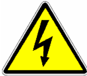
TENSIONE ELETTRICA PERICOLOSA