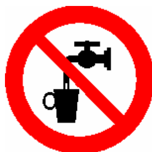
ACQUA NON POTABILE