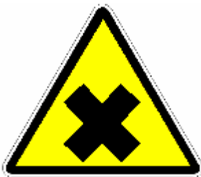
SOSTANZE NOCIVE O IRRITANTI