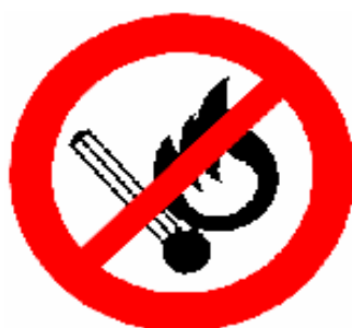
VIETATO USARE FIAMME LIBERE