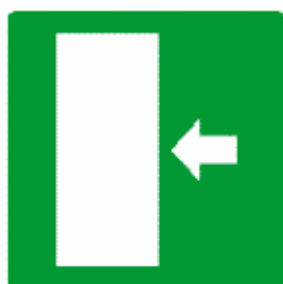
PERCORSO/USCITA DI EMERGENZA