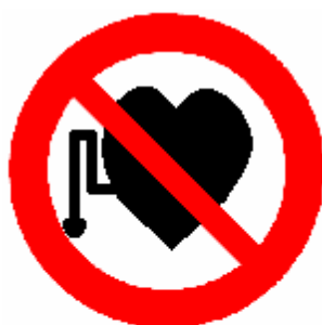
VIETATO L'ACCESSO AI PORTATORI DI STIMOLATORE ELETTRICO CARDIACO (PACE-MAKER)