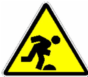
PERICOLO DI INCIAMPO