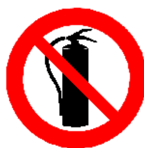
VIETATO USARE ESTINTORI