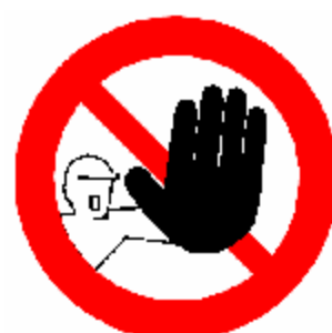
DIVIETO DI ACCESSO ALLE PERSONE NON AUTORIZZATE