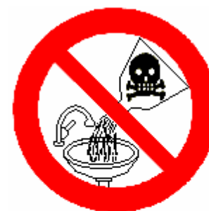
VIETATO GETTARE SOLVENTI E SOLUZIONI ACQUOSE NEGLI SCARICHI