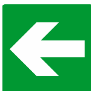
DIREZIONE DA SEGUIRE (cartello da aggiungere a quelli che precedono)