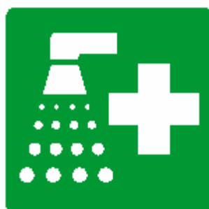
DOCCIA DI EMERGENZA